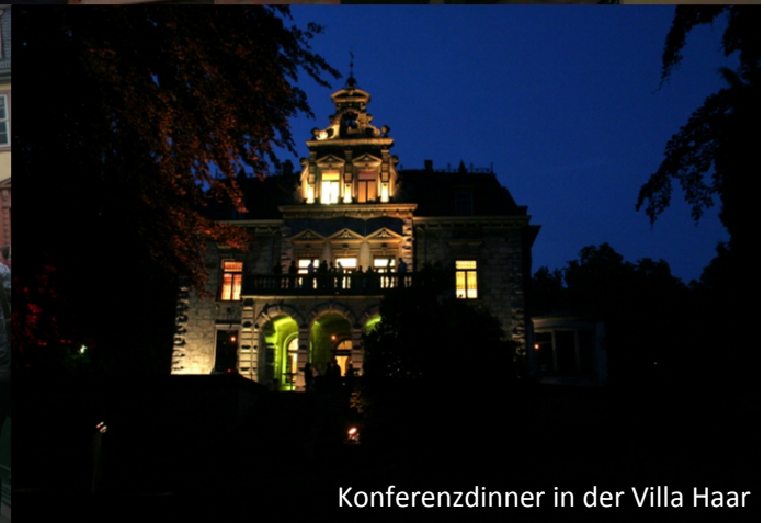
Konferenzdinner in der Villa Haar